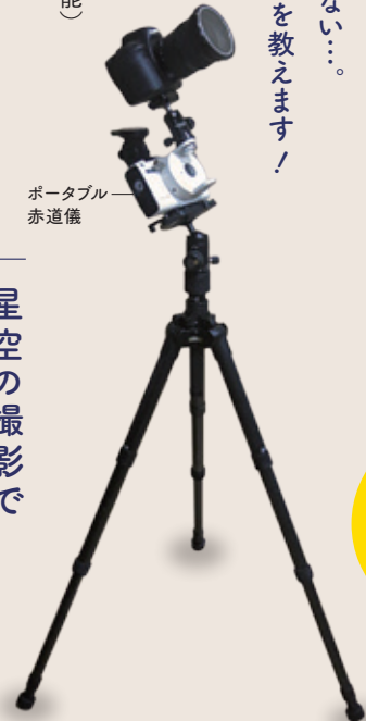
ポータブル 赤道儀